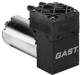
图示带可选配的盖子